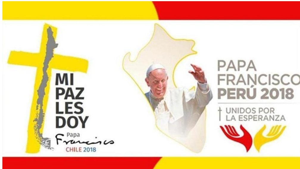
Logo cho chuyến viếng thăm của ĐTC tại Pê-ru từ ngày 18-22/1/2018