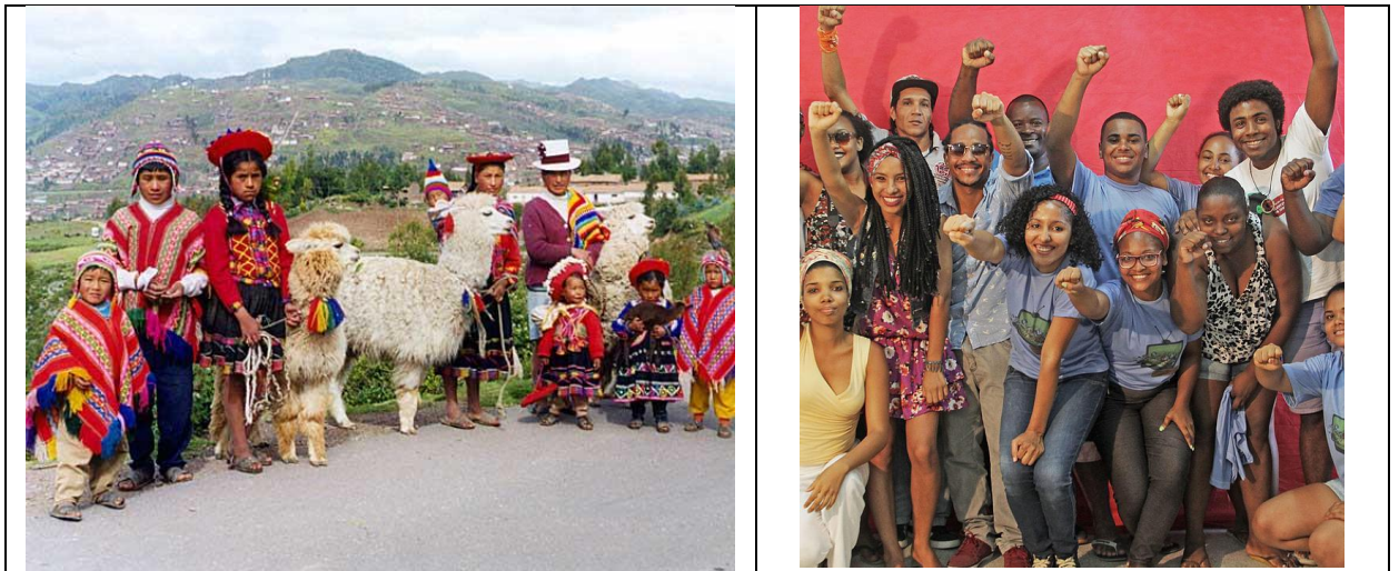
Người dân Pê-ru theo cổ truyền & giới trẻ ngày nay