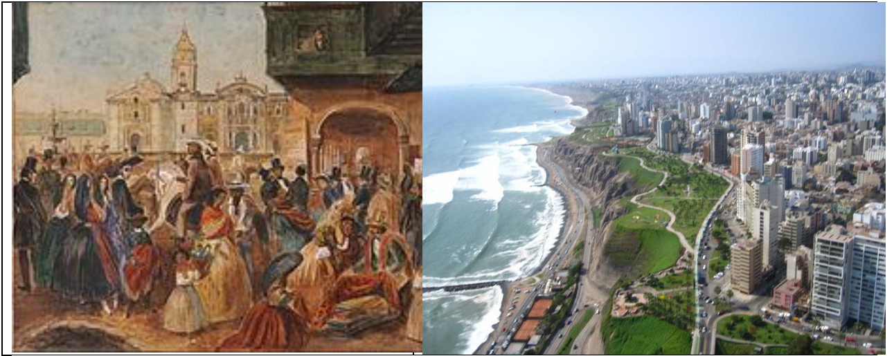
Quảng trường chính của Lima khoảng vào năm 1843 và TP Lima ngày nay.