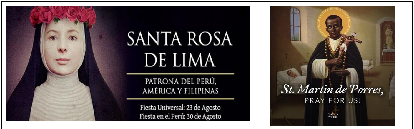
Thánh nữ Rosa de Lima & Thánh Martin de Porres