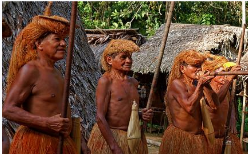
Người da đỏ Pê-ru tại các vùng rừng núi Andes.

Giáo Hội Công giáo được du nhập vào Pê-ru theo các bước chân những nhà thám hiểm và quân đội Tây Ban Nha vào những năm 1532. Năm 1920 đạo Công giáo chính thức được Hiến pháp Pê-ru nhìn nhận với quyền Tự do tín ngưỡng, nhưng mãi đến năm 1929 Học thuyết Công giáo mới được đưa vào chương trình giảng dạy tại các trường công cũng như tư thục.