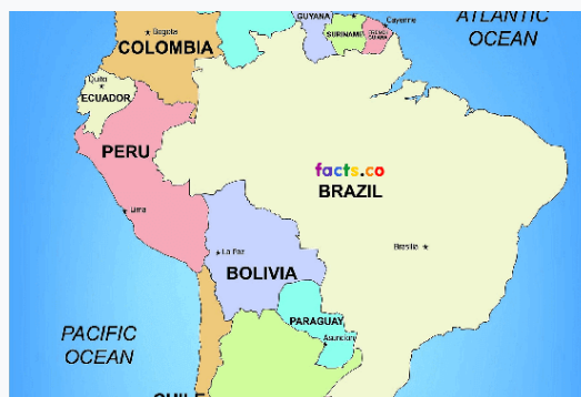
Bản đồ nước Pê-ru và các quốc gia lân cận